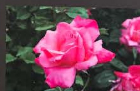
ステファニー・ドゥ・モナコ