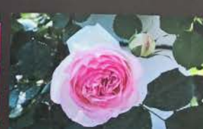
ビエール・ドゥ・ロンサール