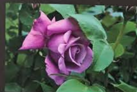
シャルル・ドゥ・ゴール